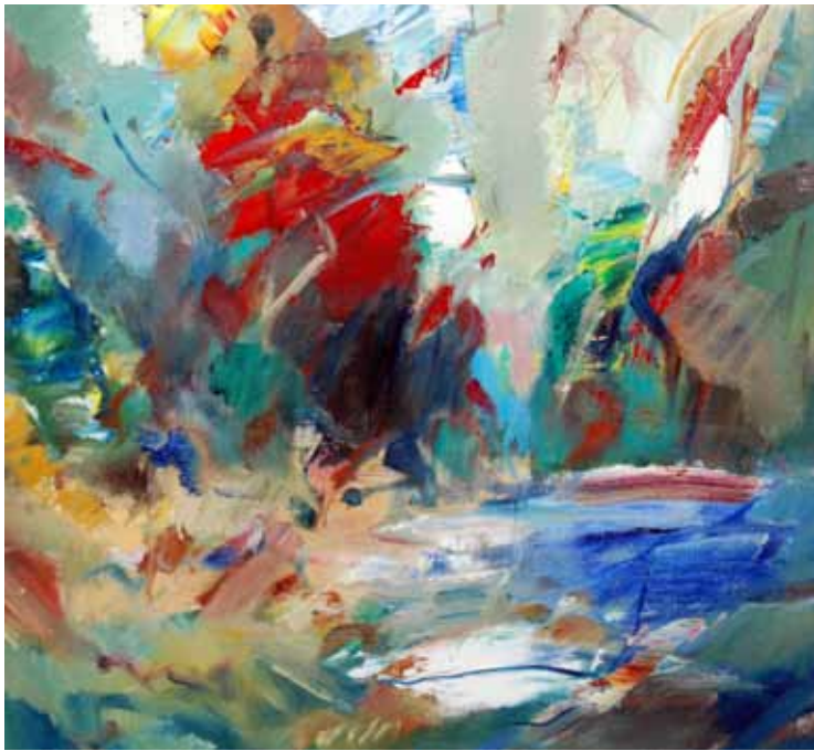
Tex Berg - "Övergång II"