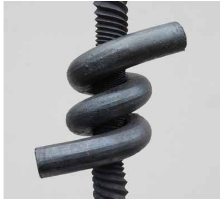
Lars Larsson - "Vridet objekt"